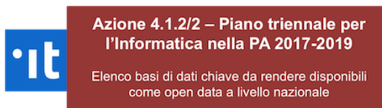
Fig. 1.2: Figura 2: Seconda azione open data del piano triennale per l'informatica nella PA

Digitale (AgID). In particolare, il processo si è avviato principalmente nell'ambito di una task force istituita e coordinata dal Team Digitale e l'AgID. La task force, chiamata “#DatiPubblici Task Force”, è composta da amministrazioni locali, sia regionali che comunali, particolarmente attive da diversi anni nell'ambito open data. L'Appendice I elenca le amministrazioni coinvolte nella task force).