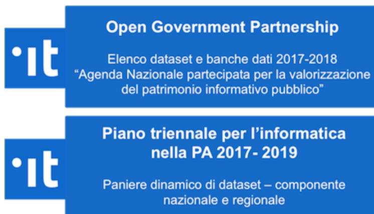
Fig. 1.1: Figura 1: Iniziative di individuazione di dataset e basi di dati da rendere disponibili come open data

Nel 2017 alcune iniziative di rilievo hanno individuato dataset e basi di dati da rilasciare come dati aperti secondo i piani di rilascio di diverse amministrazioni pubbliche coinvolte nelle iniziative. Quest'ultime sono riportate nella figura sottostante.